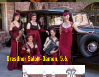
Dresdner Salon-Damen, 5.6.