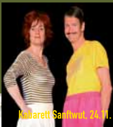
Kabarett Sanftwut, 24.11.