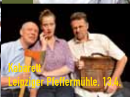
Kabarett Leipziger Pfeffermühle, 13.4.