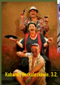
Kabarett Herkuleskeule, 3.2.

16. bis 18. Juni Modellballon-Fahrer-Treffen