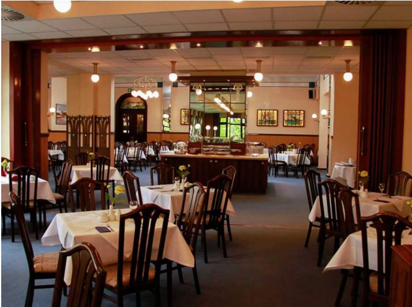
Restaurant im Kurhaus